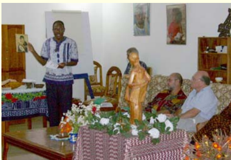
Réunion du Chapitre

L'évaluation positive faite par les Frères, l'enthousiasme et la vie qui se détachent des travaux capitulaires ce sont des signes d'espoir pour les Frères du District, formé actuellement par 68 Frères, dont 49 sont africains et 35 d'entre eux profès perpétuels. Huit novices commencent leur seconde année.