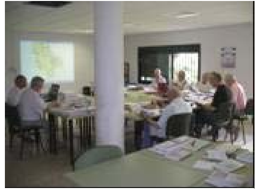
Séance de travail en groupe