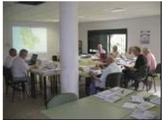
Sesión de trabajo en grupo